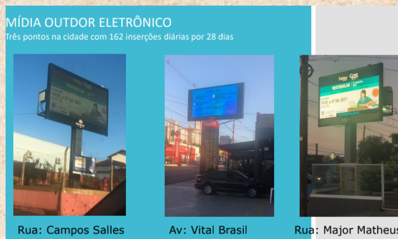
Outdoors divulgando o Vestibular na cidade.

Um verdadeiro time formado por colaboradores desde a direção, incluindo funcionários, professores, coordenadores, alunos e voluntários desenvolveram um trabalho maciço junto às rádios com entrevistas e divulgação, mídias indoor, Solutudo, Facebook, Instagram, Diretoria de Ensino, escolas, empresas industriais, comerciais, prestadoras de serviços, incluindo as transportadores, educacionais, governamentais das cidades da região e de Botucatu foram visitadas e em três pontos importantes da cidade de Botucatu foram utilizados outdoor eletrônico para a divulgação do Vestibular.