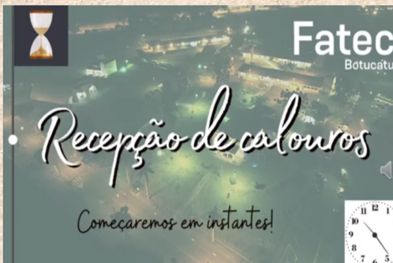
Live de recepção dos calouros no YouTube.

Ainda com aulas online devido à Pandemia do Covid-19, a exemplo do que ocorreu no primeiro semestre de 2021, a Fatec recebeu os novos calouros de forma online, iniciando por um treinamento básico para os novos calouros, no final de julho próximo passado, desde o período da manhã para os novos alunos do curso de Análise e Desenvolvimento de Sistemas e a partir das 19:00 para os calouros dos cursos noturnos de Radiologia, Logística, Agronegócio, Produção Industrial e ADS, aos moldes das recepções anteriores.