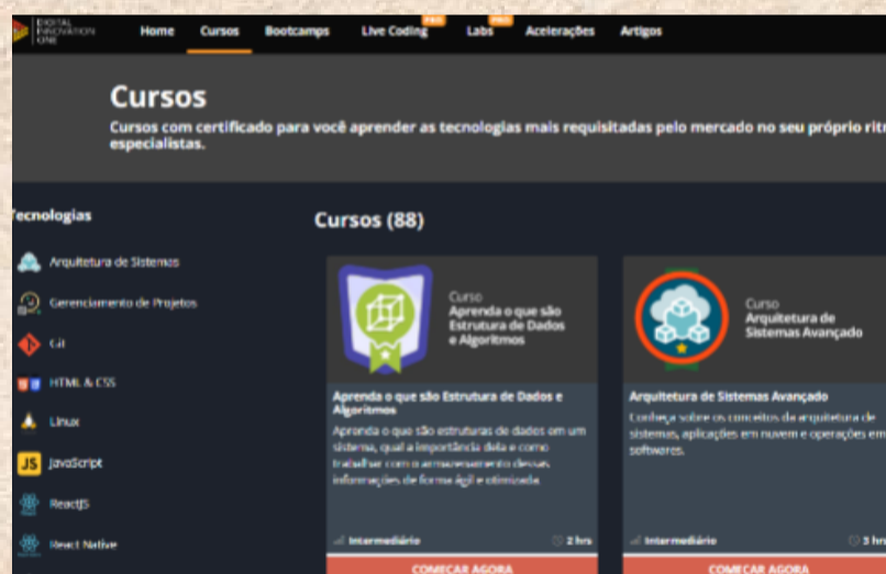
Página de cursos disponíveis na plataforma DIO.