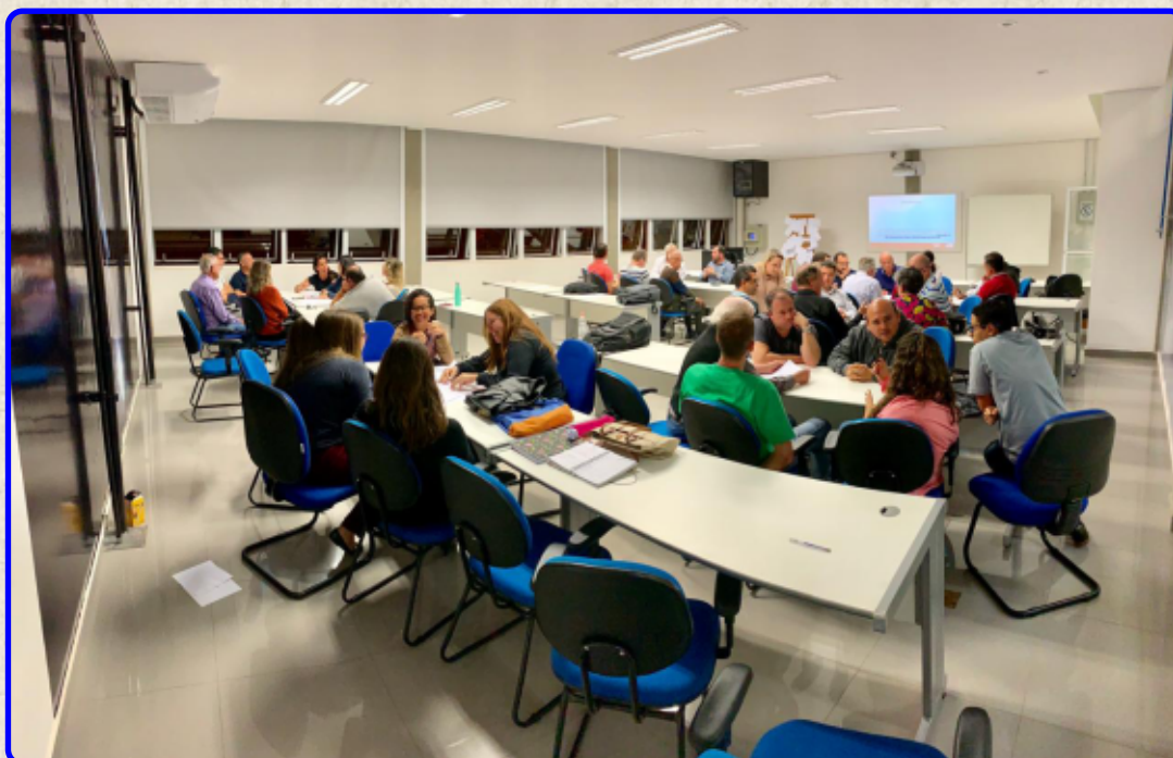
Treinamento V SPAP Fatec Botucatu