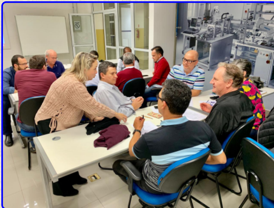
Treinamento "Metodologia Scrum"